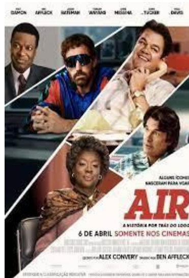
Air: a História por trás da Logomarca (em cartaz nos cinemas)