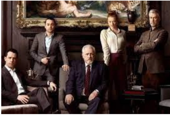
Série Succession (4ª temporada) HBO Max